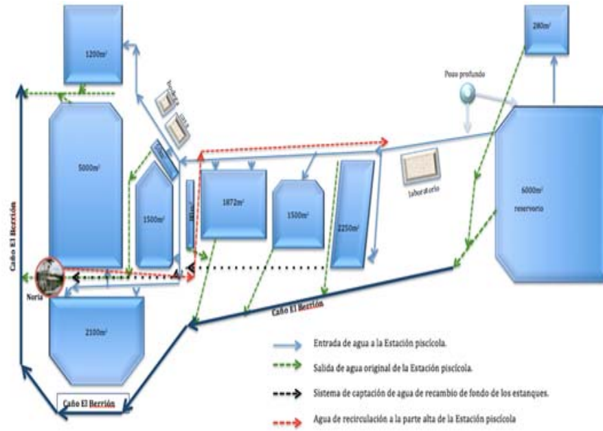
Figura 3. Plano general del sistema de recirculación de agua con la Noria modificada de la Estación Piscícola de la Universidad de Caldas.

Haga clic sobre la imagen para ampliarla