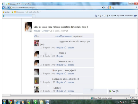
Fuente: Trabajo de campo. Perfil del Facebook de una consumidora de marihuana en Cartago.

Yo recuerdo que hace como 7 años yo tenía una novia y, bueno, un día nos fuimos a encerrar [a un motel] y listo, todo muy bien allí en el motel, todo una belleza. Entonces yo le dije a la china [mujer] que si íbamos a fumar un poco de marihuana. Ella sabía que yo fumaba y ella me había contado que ella ya había fumado hacia algún tiempo... Parece, lo quemamos los dos. ¡Uff, marica, qué chimba! Yo me acuerdo de eso. Yo recuerdo que los dos nos montamos en una película del deseo, de la pasión con esa nena... Yo ese día me di cuenta que hacer el amor trabado es lo mejor, y mucho más si lo hace uno con la pareja. Parece, la marihuana le da a uno como esa arrechera , esas ganas tan hijueputas de pegarle a eso, es como una adrenalina que uno siente, es mucho placer, mucha pasión. (Entrevista no. 13)