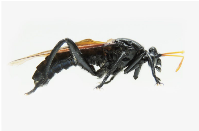
Figuras 5-6. Adulto de Gauromydas procedente de Caldas.