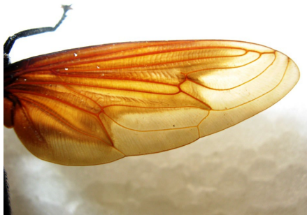
Figuras 2-3. Adulto de Gauromydas heros mostrando su venación.