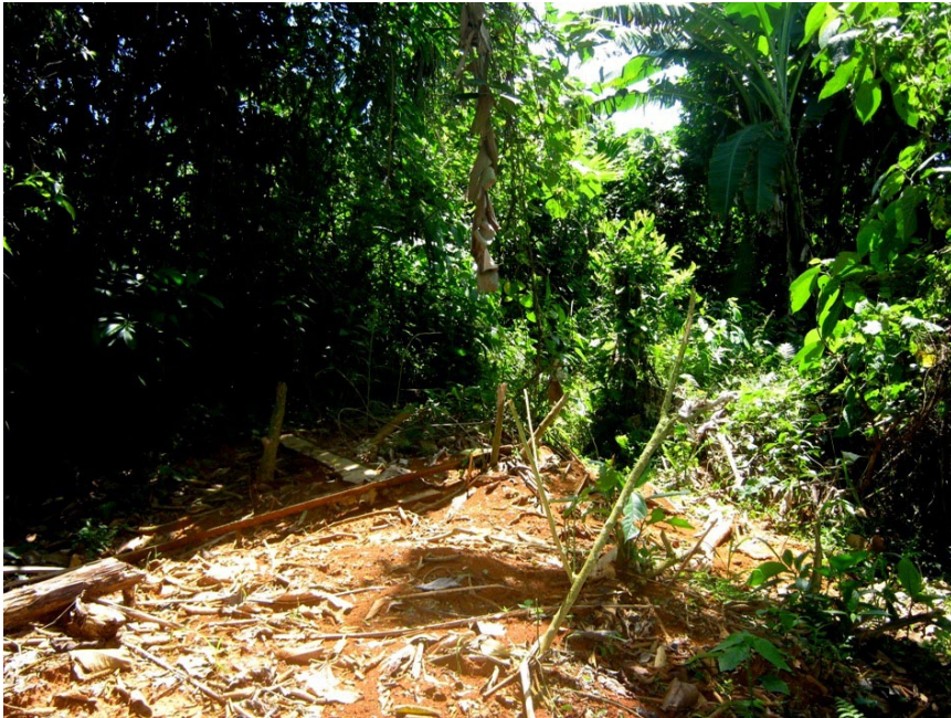
Figura 4. Hormiguero donde se observó a G. heros (Manizales, Caldas).

Si bien en nuestro medio su biología permanece completamente desconocida, ya ZIKAN (1942, 1944) con base en sus largas observaciones realizadas en Brasil, logró publicar detalladamente la biología de esta mirífica especie en nidos de hormigas arrieras. Dicho autor ilustra el huevo y la larva de G. heros , además publica una fotografía con más de 60 ejemplares de ambos sexos de la especie capturados en hormigueros del Parque Nacional Itatiaia, en el Estado de Río de Janeiro. Asimismo, ZIKAN (1944) da a conocer el extraordinario parecido de G. heros con especies de avispa solitarias del género Pepsis (Hymenoptera: Pompilidae), figura que fue reproducida más tarde por PAPAVERO (2009) (ver igualmente a AUSTEN, 1910). Dicho mimetismo de tipo batesiano es notable, pues los individuos observados en Colombia, en las proximidades a los hormigueros de Atta spp., se comportan como avispas, frotando las alas y moviendo las antenas permanentemente. Se avistaron dos ejemplares en las inmediaciones de un nido de hormigas, ubicado en el bosque de Bavaria (Villavicencio, Meta) de los cuales se capturó uno (Figura 2), y otros dos en otro hormiguero situado en el municipio de Manizales (vereda Malpaso) y posados sobre las ramitas emergentes que nacen del hormiguero (Figura 4).