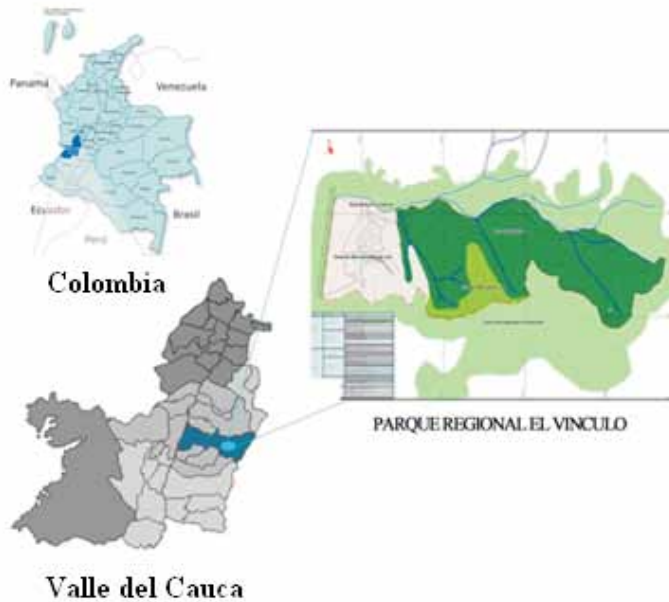
Figura 1. Ubicación de la zona de estudio.

demás ejemplares fueron guardados en sobres y almacenados según la teoría de envolturas, en bolsas de sierre hermético y depositados en la colección CEH-085 del Registro Nacional de Colecciones Biológicas. Adicionalmente, los nombres científicos fueron contrastados y actualizados teniendo en cuenta el Atlas of Neotropical Lepidoptera (LAMAS, 2004).